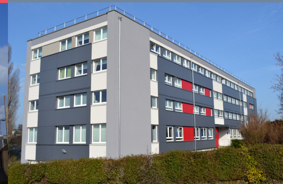
Résidence Sanson 19, rue du Père Sanson - 14000 Caen