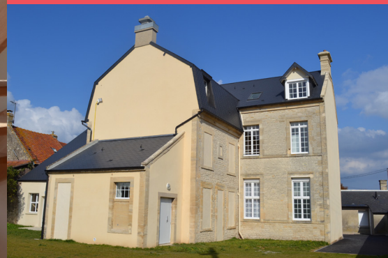
Résidence Blagny 5, rue Morel de Than - 14780 Lion sur mer

Foyers de Jeunes Travailleurs Résidences sociales